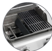
Grade de cozimento