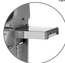
Mesa lateral dobrável