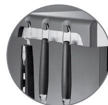
Ganchos para ferramentas