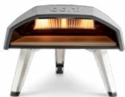
Ooni Koda 12