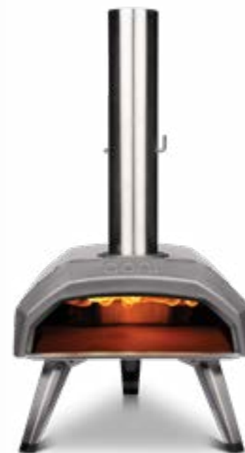
Ooni Karu 12