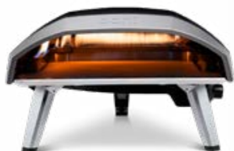
Ooni Koda 16