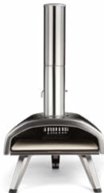
Ooni Fyra 12