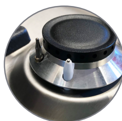
Gas Control System